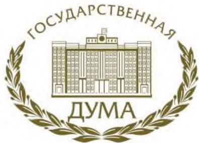
Государственная Дума Российской Федерации