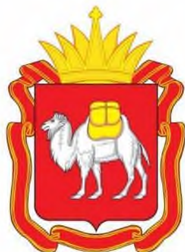
Правительство Челябинской области