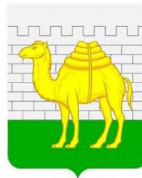
Администрация г. Челябинска